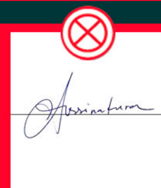
Com linhas horizontais