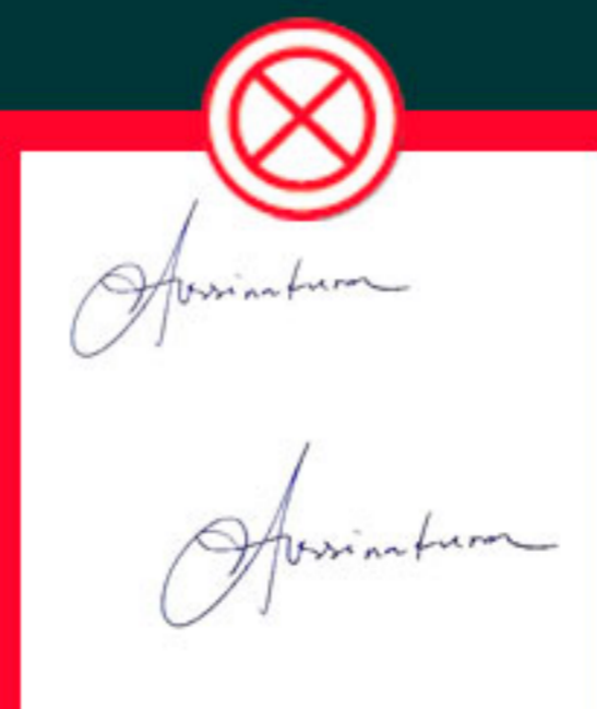
Com a assinatura em duplicidade