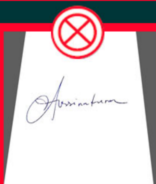
Com excesso de bordas que não sejam brancas