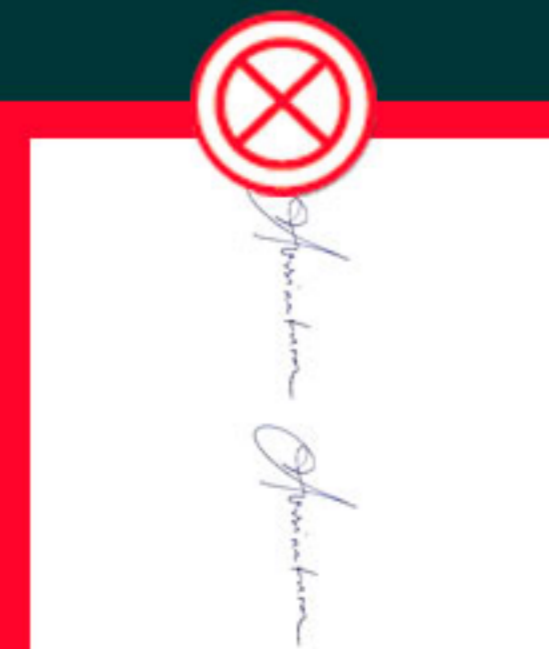
Com a assinatura na vertical