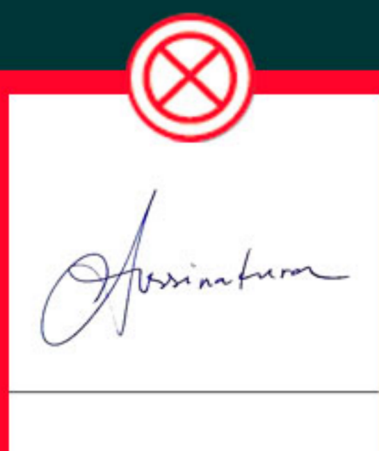
Com linhas horizontais sobressalentes