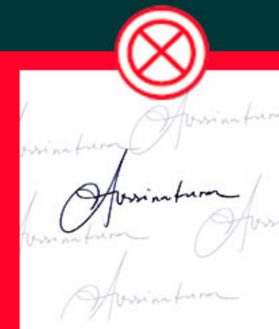
Com sombras ou marcas d'água