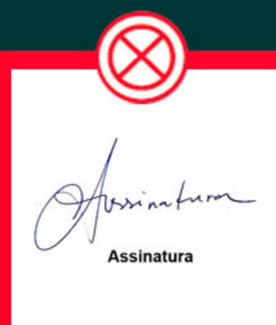
Com o nome digitado abaixo