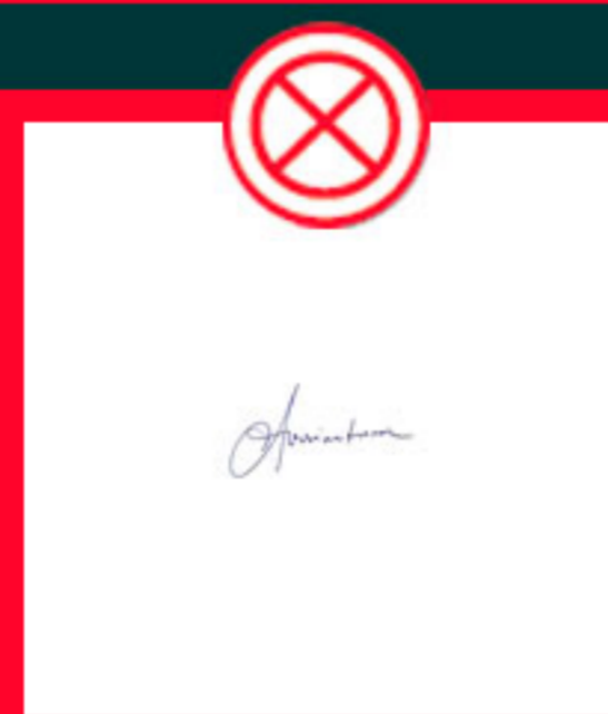
Com excesso de bordas